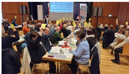
Abstimmung zur Beitragsanpassung der Mitgliedsbeiträge.

Auf der Tagesordnung standen neben der Vorstellung und Aussprache der Geschäftsberichte aus dem Jahr 2022 ein Vortrag der GEMA, die Nachwahl im Bundesmusikausschuss des Hessischen Sängerbundes und Abstimmungen zur finanziellen Neuaufstellung des HSB. Außerdem wurde ein außerordentlicher Chorjugendtag der Hessischen Chorjugend mit dem Beschluss einer Satzungsänderung eingeschoben.