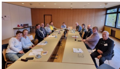
Am Nachmittag fand parallel zur Mitgliederversammlung die Konferenz der Kreis-Chorleitungen statt.

Den ausführlichen Bericht zur Mitgliederversammlung finden Sie auf unserer Homepage .