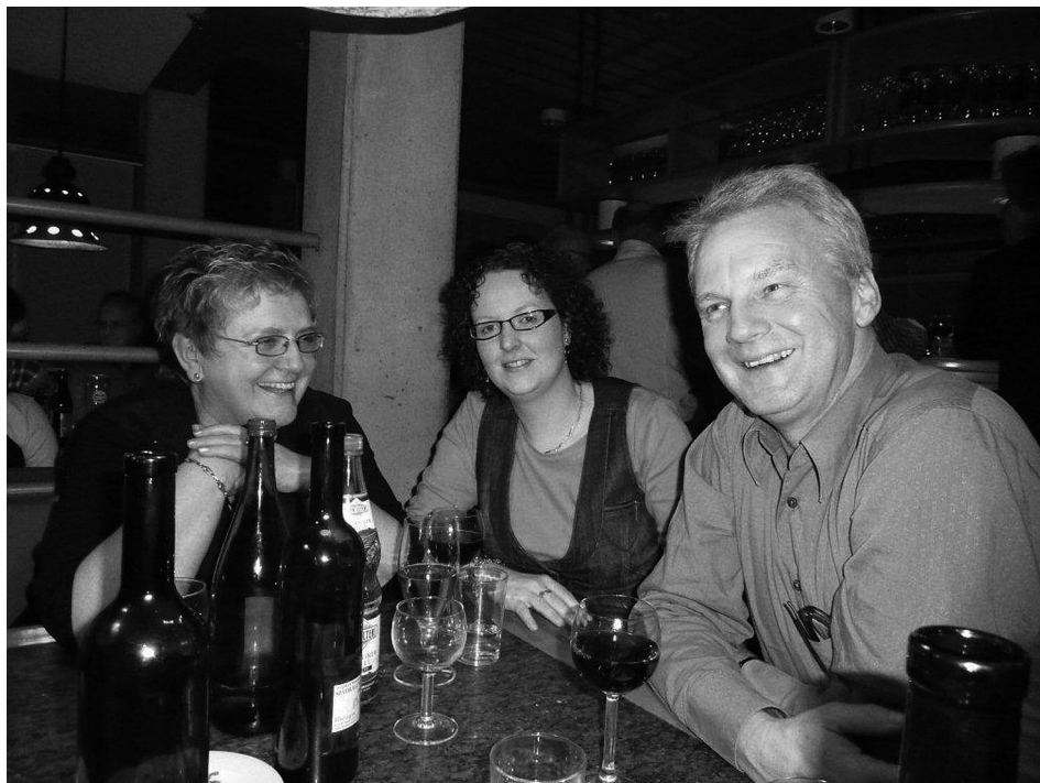
In geselliger Runde finden viele interessante Fachgespräche statt.

Den gesamten Nachmittag bis in die Abendstunden hinein steht dann das Kennenlernen skandinavischer Chormusik auf dem Programm. Bekannte Stücke wechseln sich ab mit nie Gehörtem. Die Literatur wird teils gründlich geprobt, teils wie in einer Reading-Session angesungen, um sich einen Eindruck des Stückes machen zu können. Sund hat dafür geistliche und weltliche Werke ausgewählt, die facettenreich das skandinavische Chorsingen widerspiegeln, und zwar auch in den technischen Schwierigkeiten der Kompositionen. Insbesondere im Bereich der Frauenchorliteratur wird sich mancher Teilnehmer gefragt haben, wie er wohl diese Stücke mit seinem Chor realisieren soll. Ganz zu schweigen von den anwesenden Chorleiterinnen und Chorleitern, die keinen Chor dieser Gattung leiten. Entsprechend machen sich hier erste Ermüdungserscheinungen bemerkbar, die sicherlich auf die Konzeption zukünftiger Chorleiterfortbildungen des HSB Einfluss nehmen werden. Völlig in seinem Element zeigt sich der Referent schließlich bei der Erarbeitung der Männerchorliteratur. Kein unschöner Klang wird hier einfach stehen gelassen, keine Intonationstrübung toleriert. Sund hat