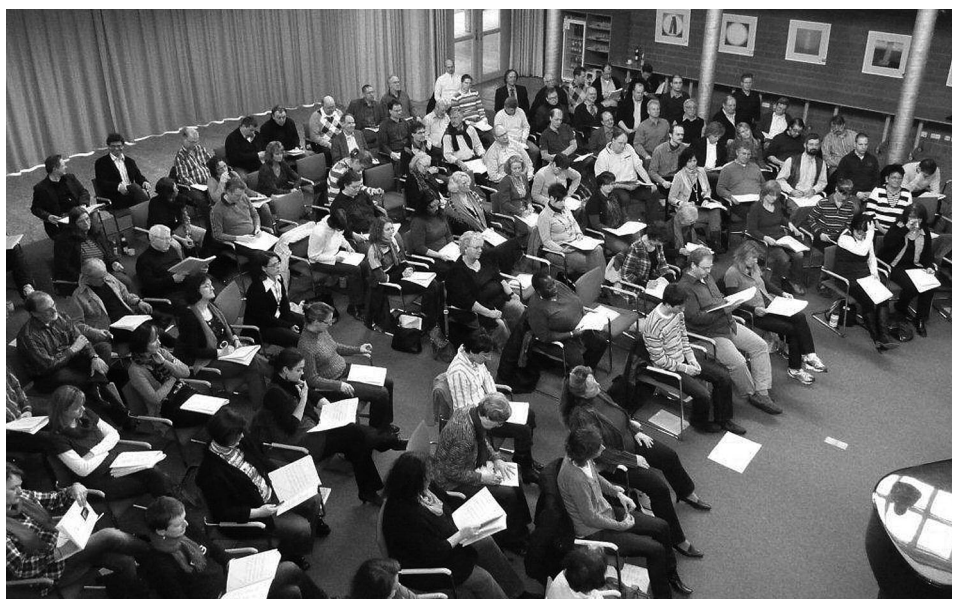
Die vollbesetzte Aula des Wilhelm-Kempf-Hauses

des Hessischen Sängerbundes so pünktlich begonnen wie diese 40. Und niemals zuvor war die Warteliste der Teilnehmer, die noch auf einen Workshop-Platz hofften, so lang. Der große Name macht's möglich. Denn der vielfach ausgezeichnete schwedische Chorleiter ist ein international